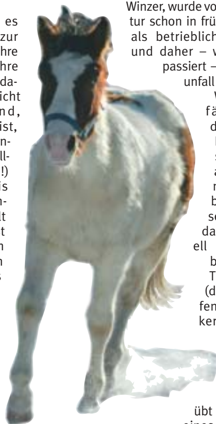
Von der Koppel in den Reitstall – wer mithilft und verletzt wird, ist selbst schuld.

Wer also Gefälligkeitsdienste oder Nachbarschaftshilfe anbietet, muss sich bewusst sein, dass er damit eventuell schon eine betriebliche Tätigkeit des (damit beholfenen) Elektrikers, Tankwarts, Bauunternehmers, etc. ausübt und im Falle eines Unfalls mit seinen Ansprüchen auf die Unfallversicherungsleistungen beschränkt ist, ein Direktanspruch gegen den unachtsamen Beholfenen jedoch nicht besteht – kein Schmerzengeld also!